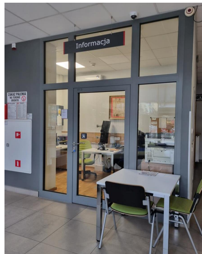
Zdjęcie: Punkt informacji