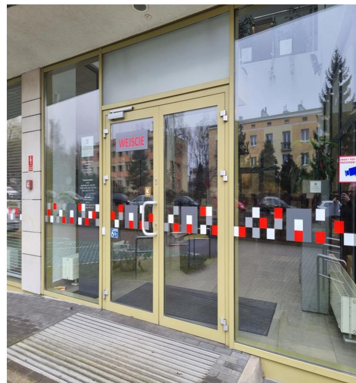
Zdjęcie: Wejście do budynku Archiwum