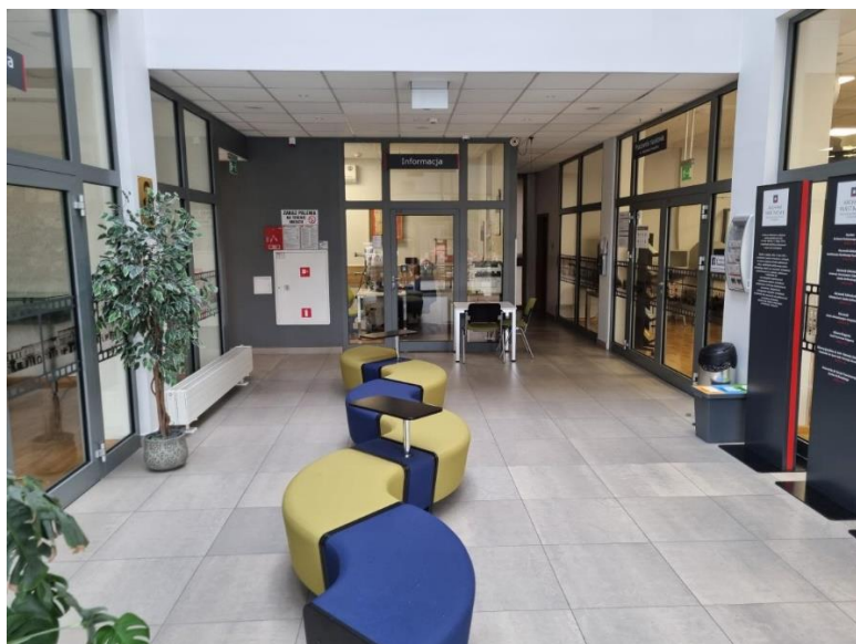
Zdjęcie: Korytarz na parterze