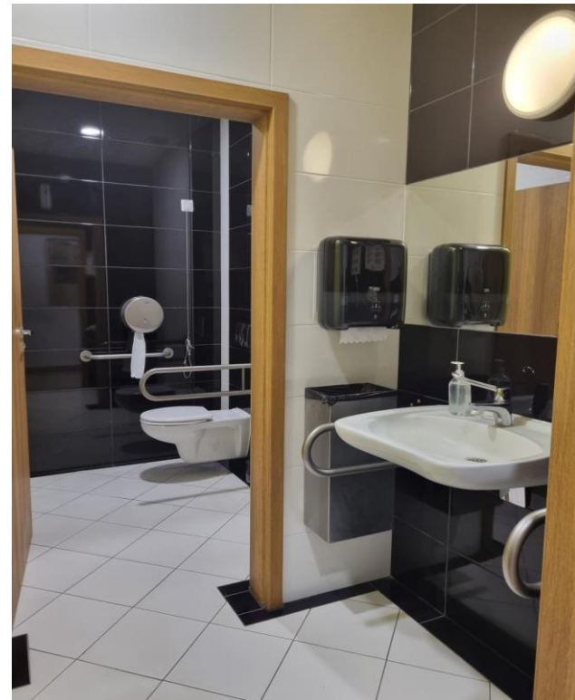
Zdjęcie: Toaleta dla osób z niepełnosprawnościami