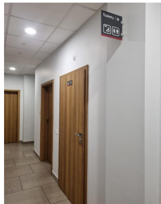
Zdjęcie: Toaleta dla osób z niepełnosprawnościami