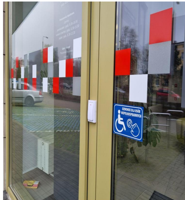
Zdjęcie: Dzwonek przy drzwiach wejściowych do Archiwum