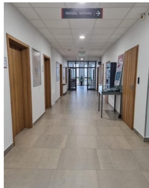
Zdjęcie: Korytarz na I piętrze