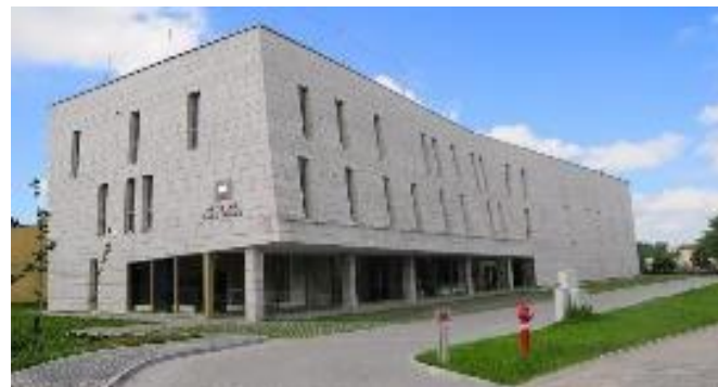
Zdjęcie: Budynek Archiwum Państwowego w Radomiu

Lokalizacja: ul. Stanisława Wernera 7, 26-600 Radom