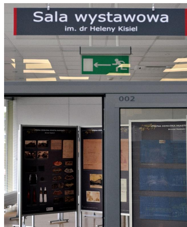
Zdjęcie: Sala wystawowa im. Dr Heleny Kisiel