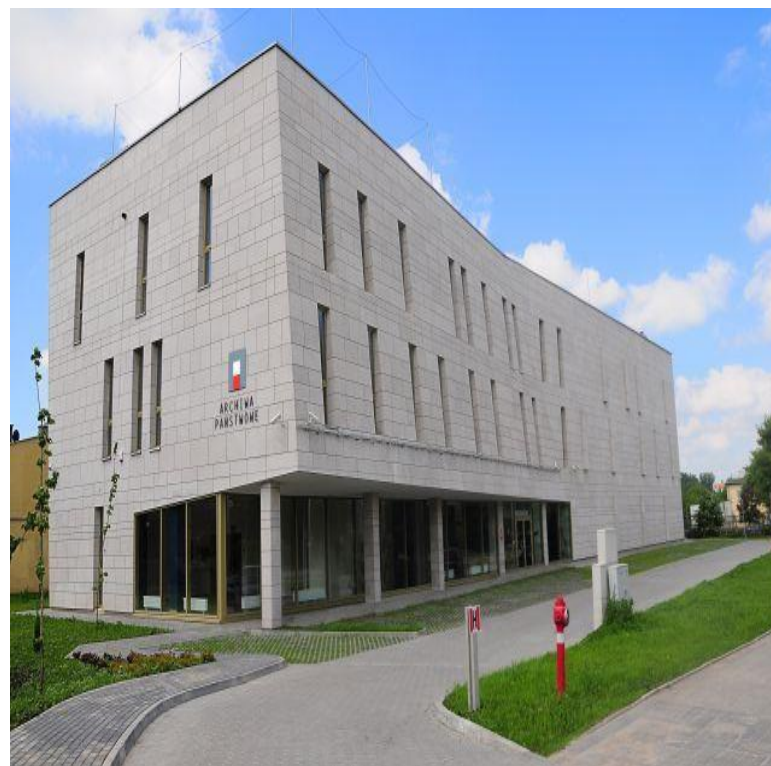
Zdjęcie: Budynek Archiwum Państwowego w Radomiu