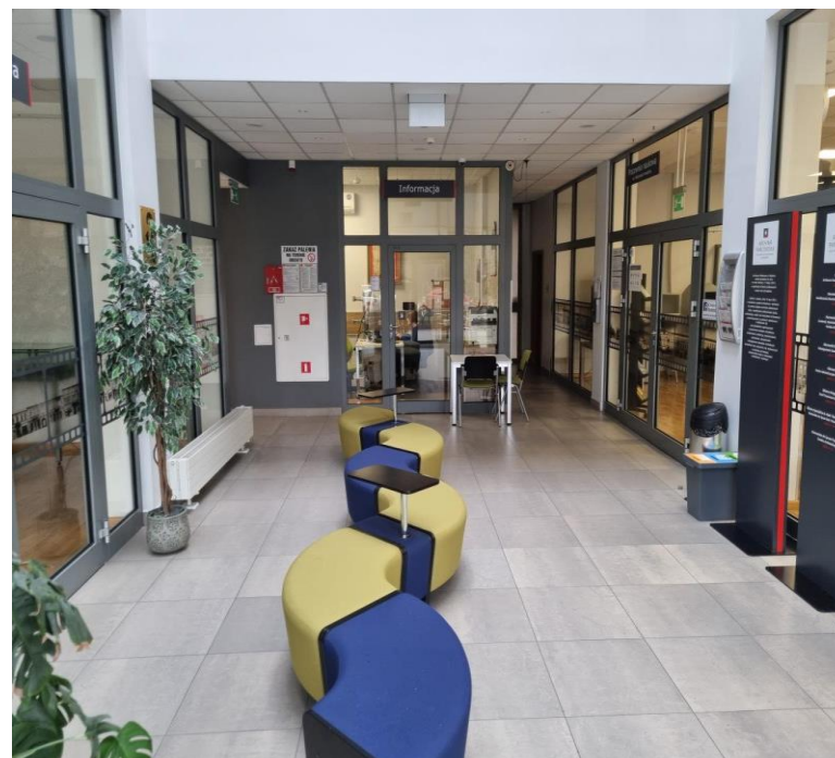
Zdjęcie: Hall główny na parterze