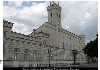
Ratusz - bryła siedziby Archiwum Państwowego w Radomiu.

Obecnie każdego dnia w południe wygrywa on uroczysty hejnał - melodię skomponowaną przez najwybitniejszego kompozytora polskiego średniowiecza Mikołaja z Radomia.