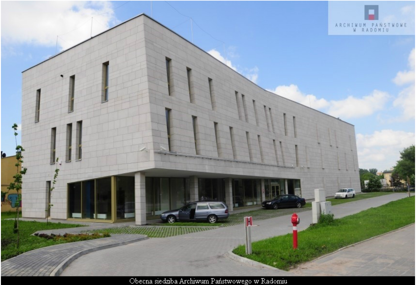
Obecna siedziba Archiwum Państwowego w Radomiu