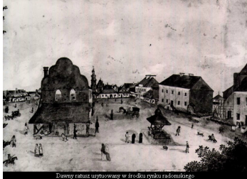
Dawny ratusz usytuowany w środku rynku radomskiego.

Siedzibą Archiwum Państwowego w Radomiu w latach 1963-2013 roku był jeden z najciekawszych zabytkowych obiektów architektonicznych na obszarze starówki - gmach dawnego ratusza miejskiego. Historia tego obiektu sięga początków XIX w., kiedy to władze miejskie przeprowadziły rozbiórkę dawnej siedziby magistratu, usytuowanej w centrum radomskiego rynku.